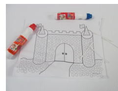
Tableau blanc, marqueurs